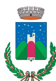
Comune di Osilo Ente Capofila